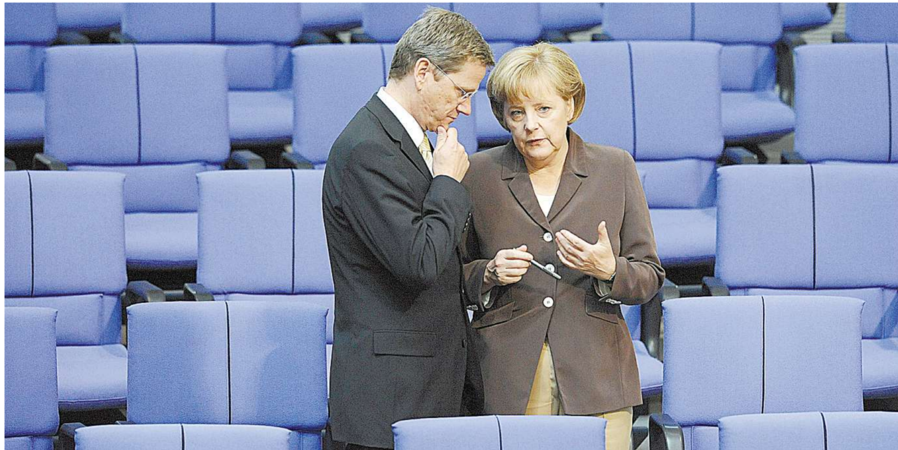
FDP-Chef Guido Westerwelle und Bundeskanzlerin Angela Merkel beim Zwiesgespräch im Bundestag: „Bei hoher Wahlbeteiligung wird es eng für Schwarz-Gelb.“

Handelsblatt-Umfrage: Wie 2005 rutschen Union und FDP kurz vor der Wahl ab – SPD und Linke mobilisieren