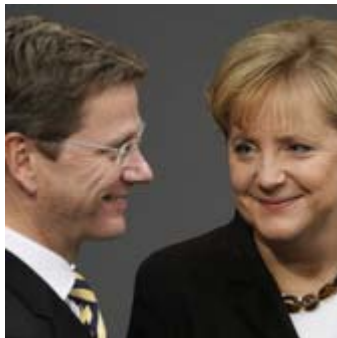
Müssen wieder um den Wahlsieg bangen: FDP-Chef Westerwelle und Bundeskanzlerin Merkel.

Angela Merkels Traum von einem Regierungsbündnis aus Union und FDP könnte platzen. Eine Handelsblatt-Umfrage deutet darauf hin, dass sich die Stimmung wenige Tage vor der Bundestagswahl dreht. Die linken Parteien schaffen es demnach besser, ihre Wähler zu mobilisieren. Auch andere Befragungen ergeben, dass die Bürger offenbar den Glauben an Schwarz-Gelb verloren haben.