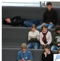
Jugendliche zu Besuch im Reichstag: Kein Interesse an Politik oder schlecht informiert?

Seit mehr als 20 Jahren sinkt die Beteiligung der unter 30-Jährigen an Bundestagswahlen - angesichts von 3,5 Millionen Erstwählern kann diese Entwicklung keinen Wahlkämpfer kalt lassen. Der Verein zur Förderung politischen Handelns versucht Schüler und Studenten mit politischen Speed-Dating-Veranstaltungen zu motivieren.