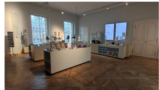
Kassenbereich Neuer Flügel