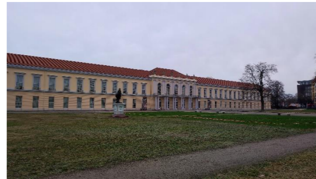
Außenansicht Neuer Flügel

Es ist in den Räumen relativ kühl, bitte entsprechend etwas wärmer anziehen.