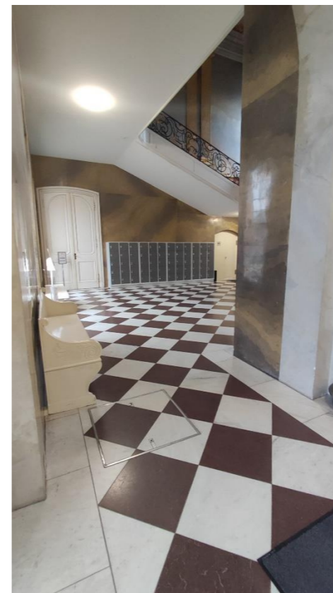
Schließfächer Neuer Flügel