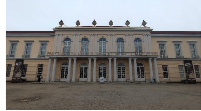
Eingang Neuer Flügel