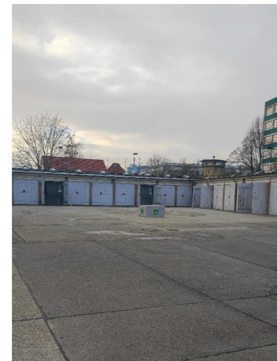
Befragungsort – Ende der Führungen