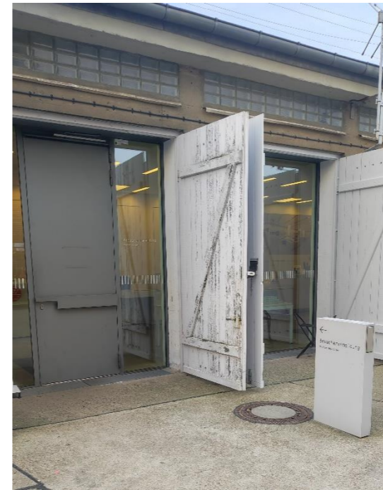
zur Anmeldung beim Kassenspersonal

Besonderheiten: Das Freigelände darf nur im Rahmen einer Führung erkundet werden. Bitte draußen nur im vorderen Bereich (vor dem roten Backsteingebäude) aufhalten.