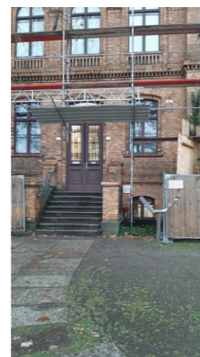
Wachschutz - LS