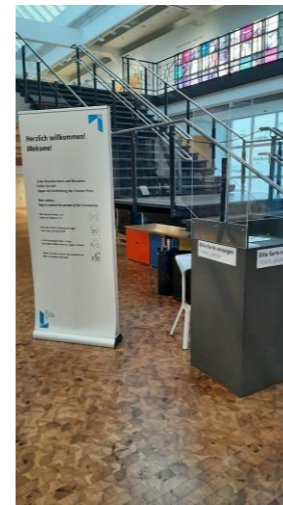
Ticketkontrolle - TS

Besondere Hinweise: Das Technikmuseum hat ein eigenes Namensschild