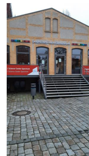
Eingang - Ladestraße