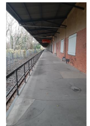
Außenbereich - LS