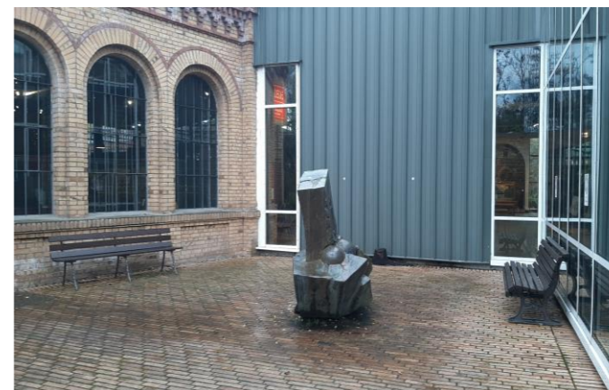
Außenbereich- Trebbiner Straße