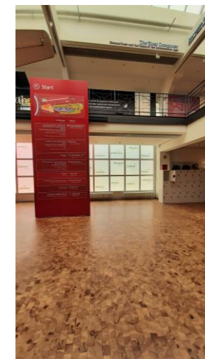
Foyer – Trebbiner Str.