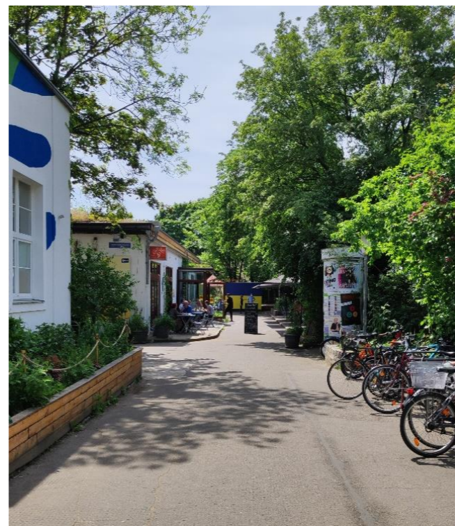
Am Ende des Weges ist der Eingang zum Theatersaal und der Freiluftbühne, davor links ist das Café