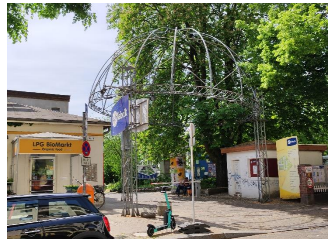
Zugang Theatersaal und Freiluftbühne

Besondere Hinweise: Nur Personen befragen, die sich die Vorstellung anschauen. Personen, die nur das Café nutzen, dürfen nicht befragt werden. Das Abendpersonal entscheidet, ob die Vorstellung angeschaut werden darf.