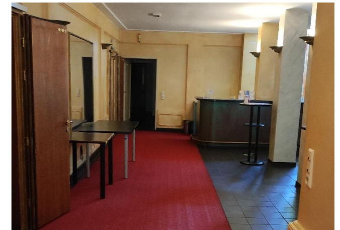
Foyer Varieté und Wolfgang Neuss Salon