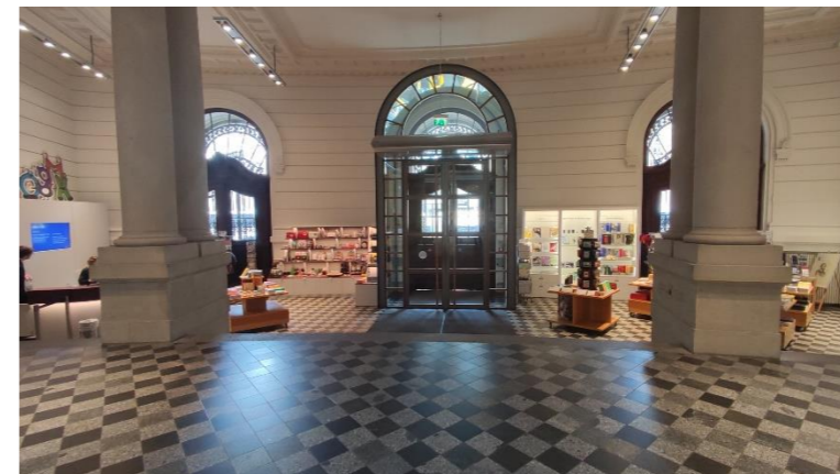
Blick zum Eingang. Befragungsstandort ist an der rechten Säule.