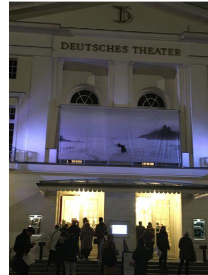
Einer der Eingänge

Bitte die unterschiedlichen Anfangszeiten der Stücke beachten (siehe Dienstplan)