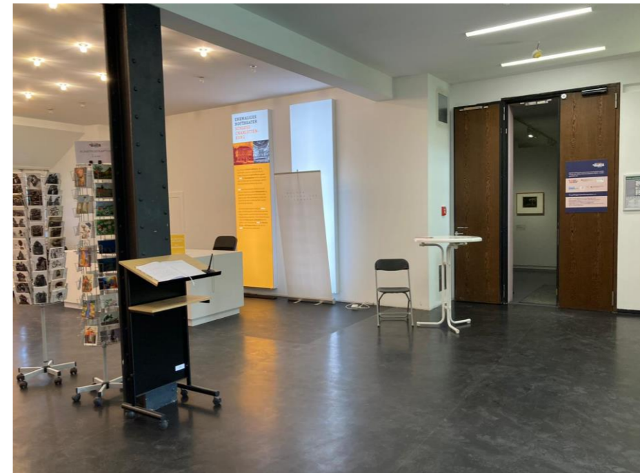
Befragungsstandort - Eingang in die Ausstellung.

Bitte Jacke/Pullover mitnehmen. Es ist noch unklar wie warm es im Foyer momentan ist.