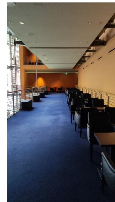
Foyer 1. OG